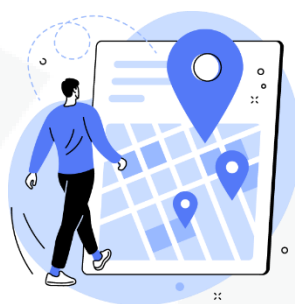
seus hábitos de deslocamento