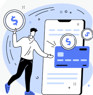
seus hábitos de consumo