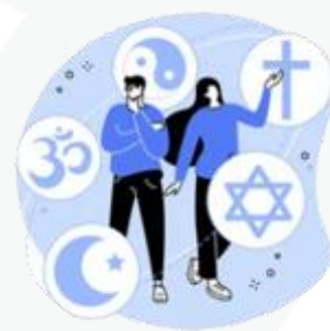
sua preferência religiosa

A partir disso, fica fácil compreender que o uso mal intencionado desses dados pode criar muitos problemas, como ocorre com os conhecidos golpes de boletos bancários, fraudes em contas de aplicativos, abertura indevida de contas bancárias e consumo indevido.